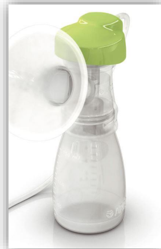
Einhandpumpset aus hochwertigem, BPA- freiem Polypropylen