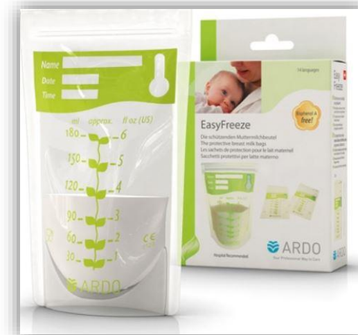
Gefrierbeutel 20 Muttermilchbeutel PVC frei