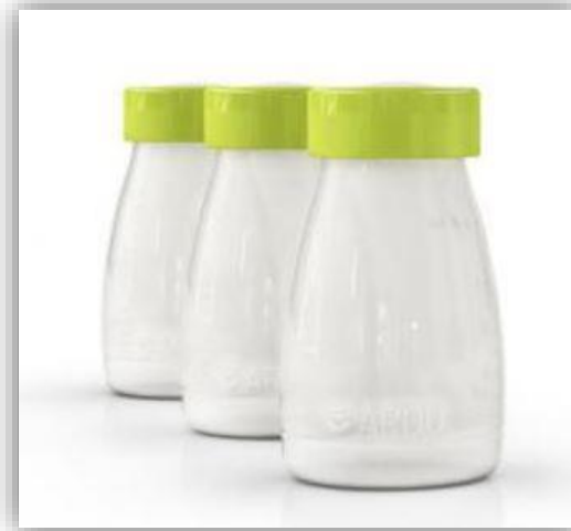
Milchflaschen 3- Set 150 ml inkl. Deckel aus Kunststoff