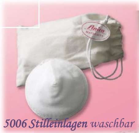
5006 Stilleinlagen waschbar