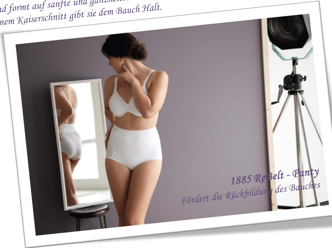
1885 ReBelt - Panty Fördert die Rückbildung des Bauches

Die ReBelt - Nachmiederhose unterstützt die Rückbildung des Bauches nach der Entbindung und formt auf sanfte und ganzheitliche Weise auch den Hüft- und Po-Bereich. Auch nach einem Kaiserschnitt gibt sie dem Bauch Halt.