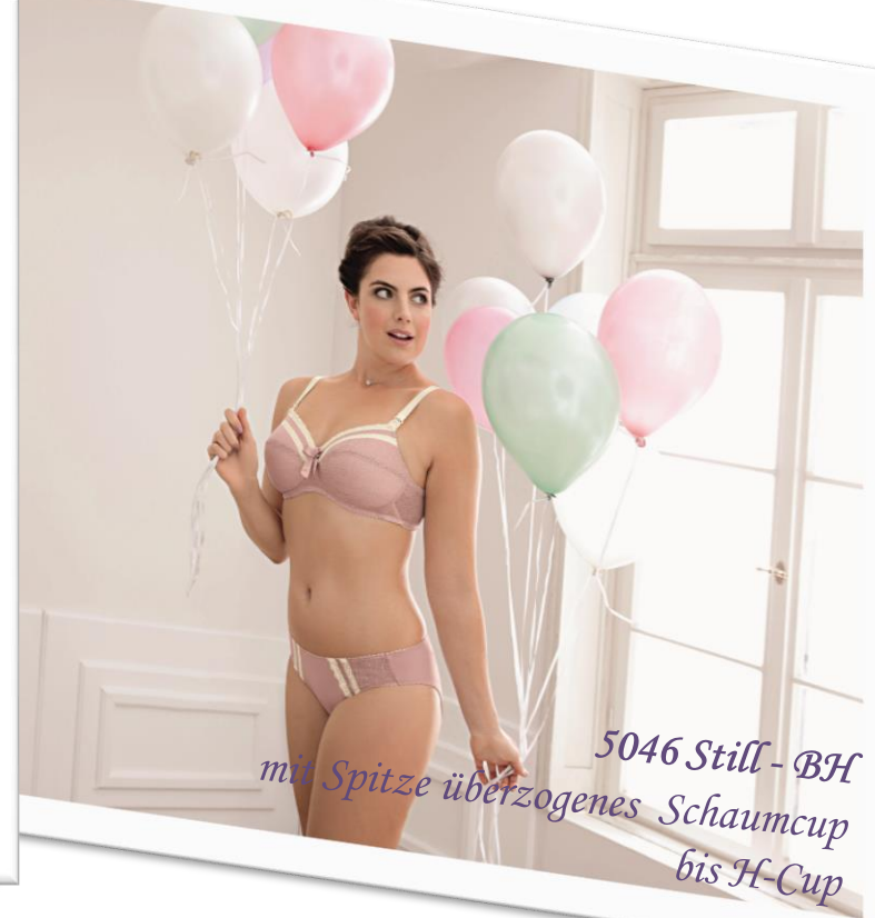
5046 Still – BH mit Spitze überzogenes Schaumcup bis H-Cup