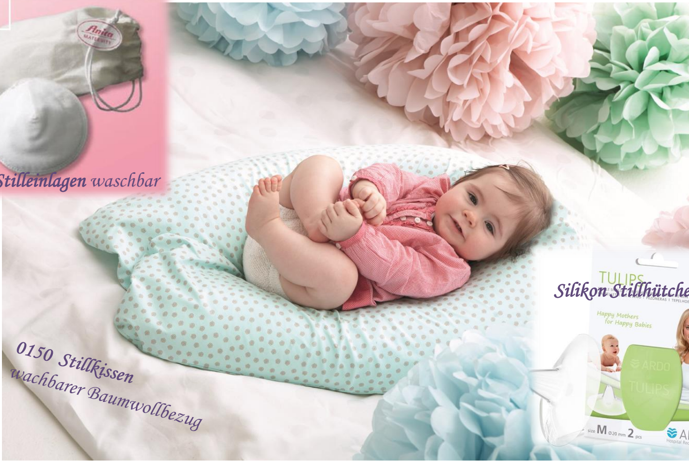
0150 Stillkissen waschbarer Baumwollbezug