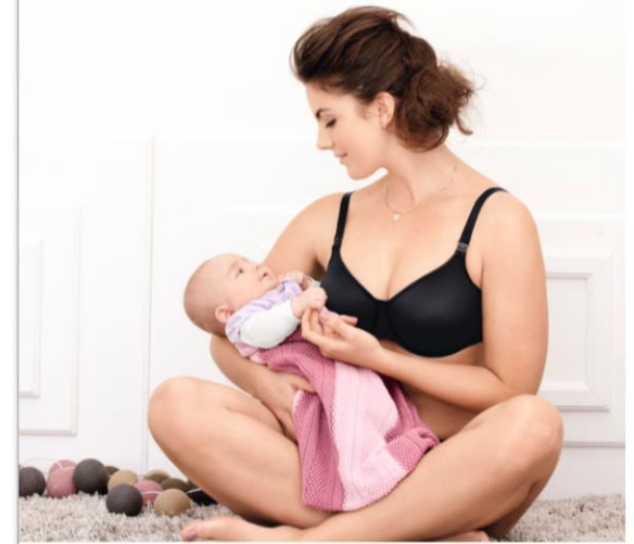
5068 Büffel Still - BH mit Still Clips bis I - Cup