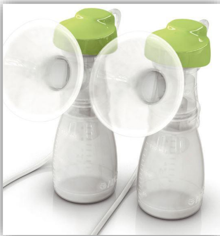
Doppelpumpset aus hochwertigem, BPA- freiem Polypropylen